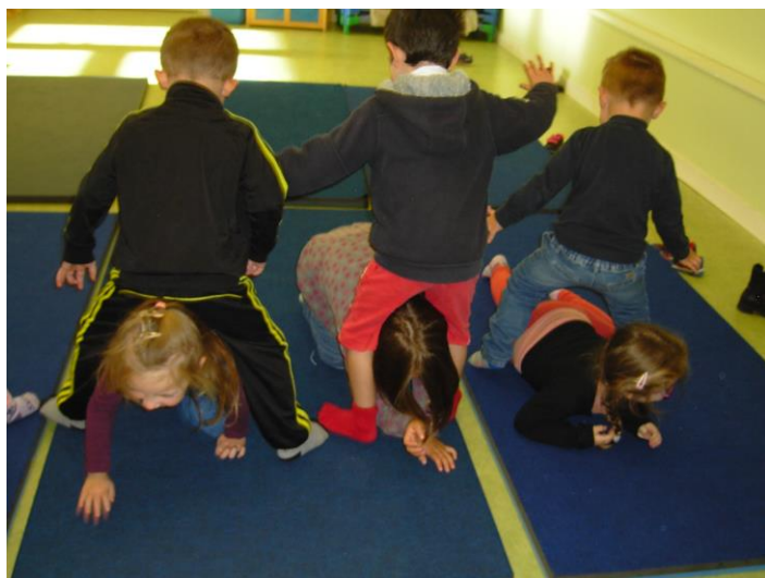
Lézards et troncs d'arbres .