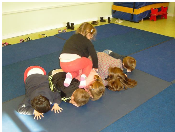
Les rochers à 4 pattes.