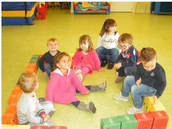
J'assemble les briques pour fabriquer une cabane.