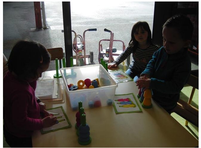
Je me repère dans l'espace.