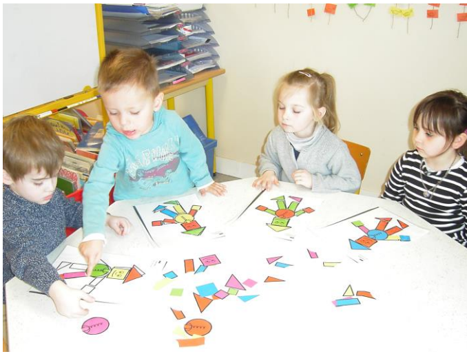
Je reconstitue mon bonhomme.