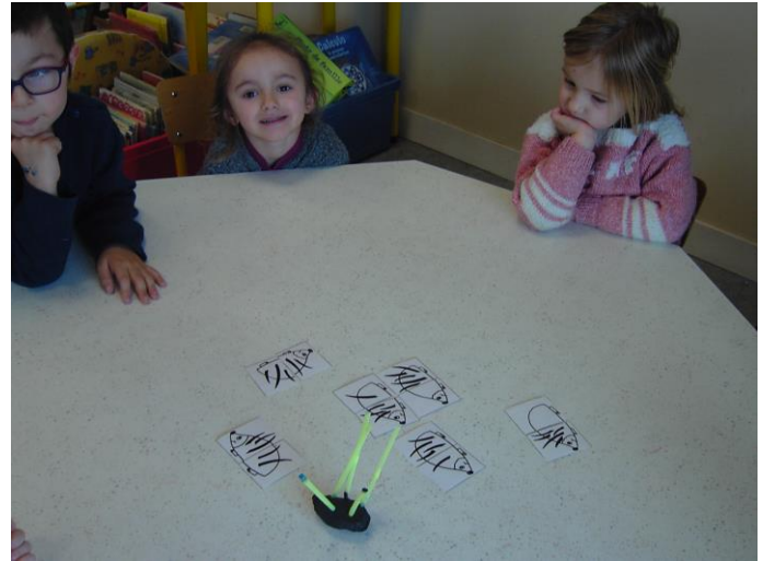
Décomposition du nombre 5.