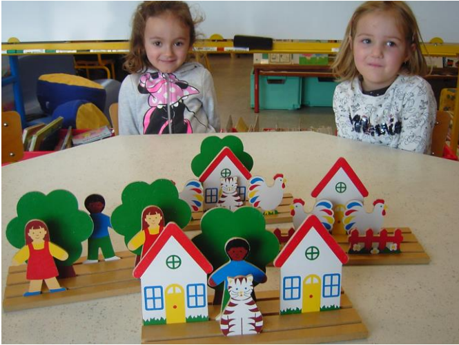
Devant, derrière, entre