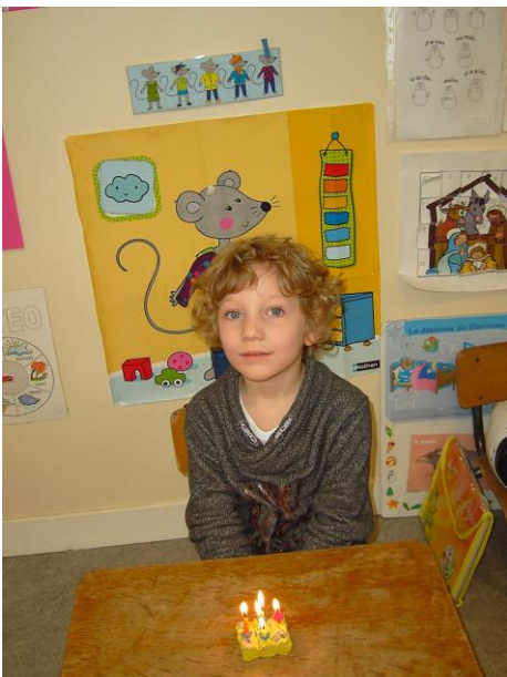
MILAN 5 ans