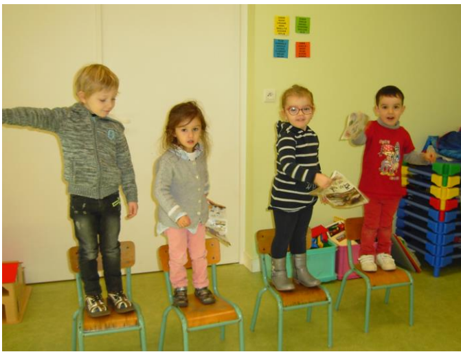
Je deviens un arbre d'automne.