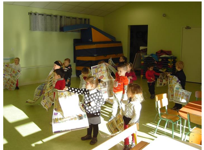
Je fais voler ma feuille.