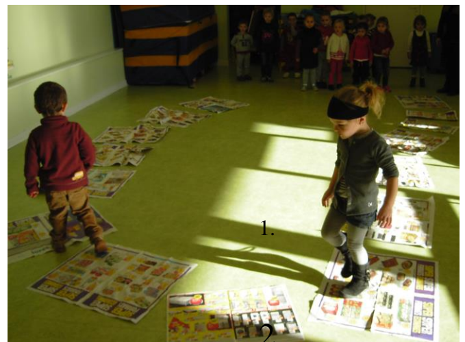
Je suis le chemin de feuilles.