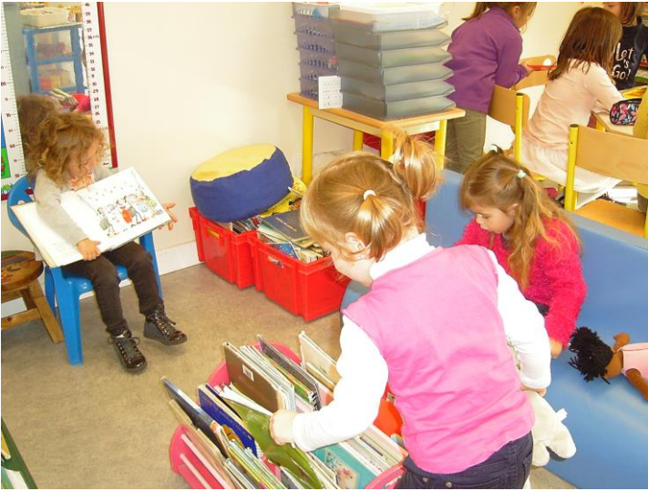
Au coin bibliothèque, je lis...