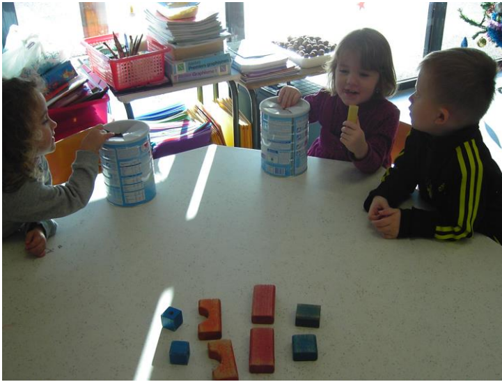
Autour des formes, tactile.