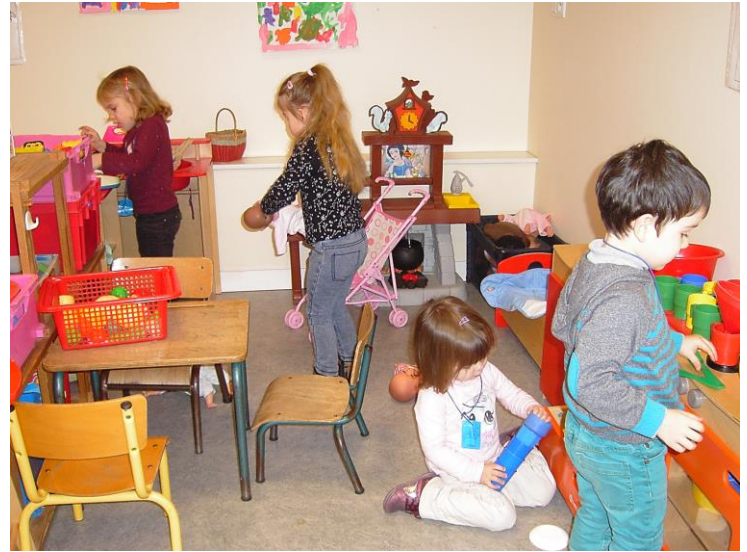
Je joue avec les autres.