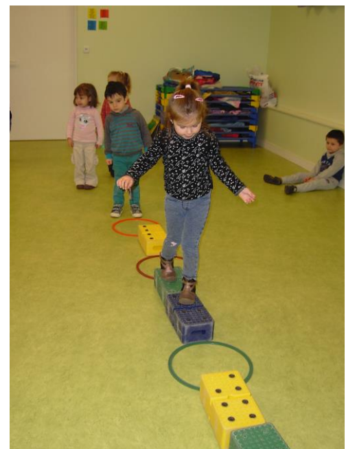
J'effectue différents parcours