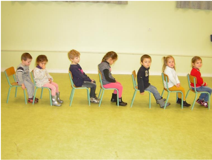
Qui est « devant », « derrière »