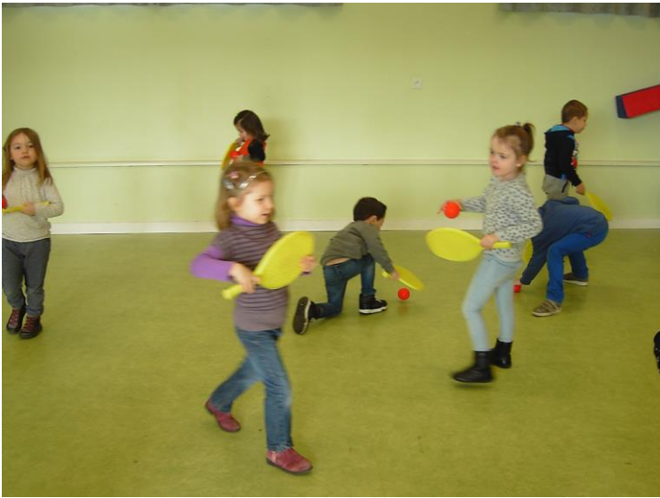
Coordination mains et yeux.